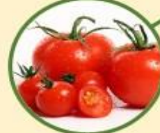
มะเขือเทศ \alpha -tomatine, \alpha -dehydrotomatine