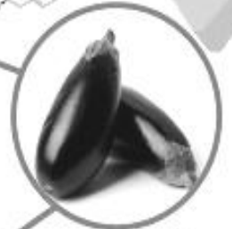
มะเขือม่วง \alpha -solasonine, \alpha -solanargine