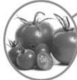
มะเขือเทศ \alpha -tomatine, \alpha -dehydrotomatine