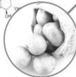
มันฝรั่ง \alpha -solanine, \alpha -chaconine